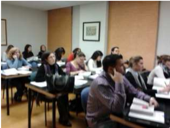
Presentación medidas de conciliación a los/las trabajadores/as