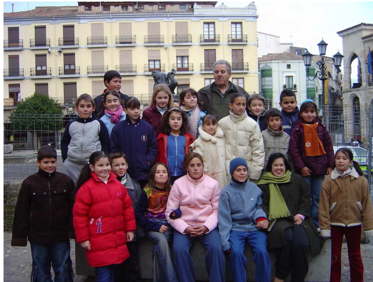
Centro Social la Natividad. Grupo de acción con el que colabora el Grupo Inzamac desde 1995. En pro de la Infancia

Inzamac colabora de manera desinteresada dentro de su Política Social con el Centro Social la Natividad que se encuentra en una de las zonas más pobres de la ciudad y su ámbito de actuación se extiende a los barrios marginales de: La Alberca, La Villarina, Las Llamas y Alto de Arenales (recientemente se incluye s.XXI pero las características de esta zona no tienen nada que ver con las de los barrios anteriormente mencionados) de la ciudad de Zamora, que carecen de las infraestructuras más elementales: