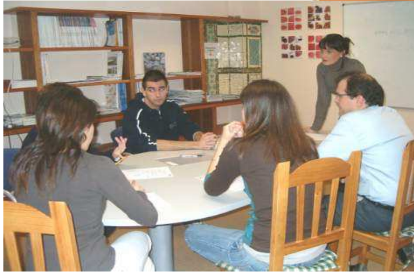
Reunión del Comité de Conciliación de Inzamac

2º Recibir la copia básica de los contratos a que se refiere el párrafo a) del apartado 3 del artículo 8 y la notificación de las prórrogas y de las denuncias correspondientes a los mismos, en el plazo de los diez días siguientes a que tuvieran lugar