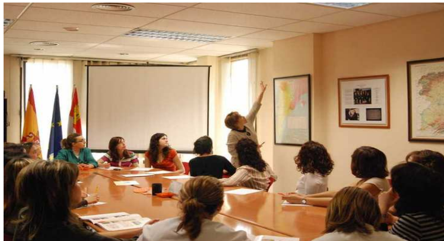
Sesión informativa en materia de conciliación y derechos