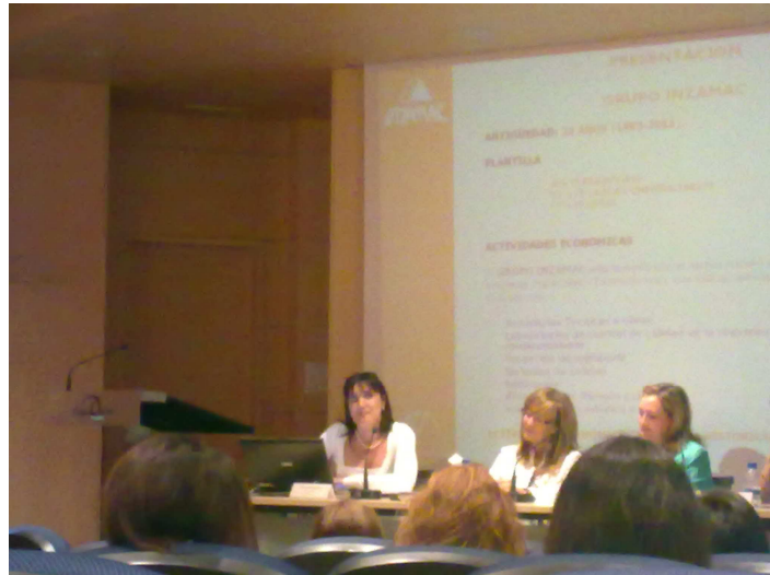
Presentación del Manual de Mobbing Laboral Grupo Inzamac