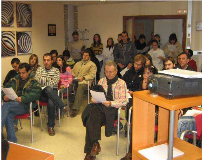
Reunión Comité de Seguridad

También tendrá derecho a recibir información, al menos anualmente, relativa a la aplicación en la empresa del derecho de igualdad de trato y de oportunidades entre mujeres y hombres, entre la que se incluirán datos sobre la proporción de mujeres y hombres en los diferentes niveles profesionales, así como, en su caso, sobre las medidas que se hubieran adoptado para fomentar la igualdad entre mujeres y hombres en la empresa y, de haberse establecido un plan de igualdad, sobre la aplicación del mismo.