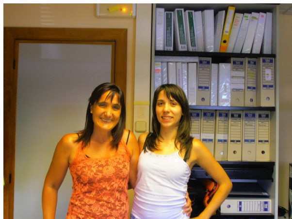
Responsables de la elaboración e impartición del curso del Grupo Inzamac

El almacenamiento de residuos, su tratamiento y eliminación, es un proceso costoso tanto en términos económicos como ambientales y sociales. Como las tecnologías saludables generan menos residuos y desechos, el uso continuado de tecnologías ineficientes puede representar un incremento sobre los costes operativos de las empresas