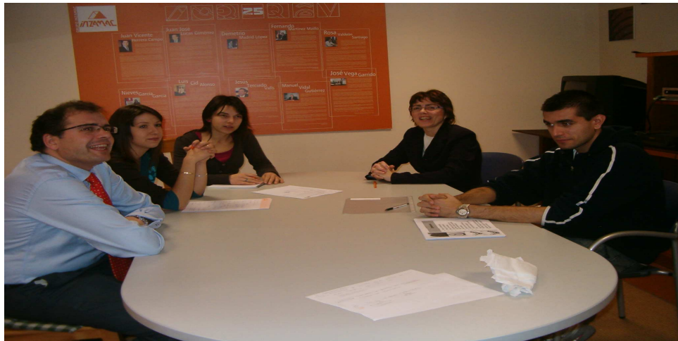
Responsables Medidas EFR. Grupo Inzamac

Bajo el marco normativo laboral español, y por ende al de la Unión Europea, resulta imposible que los trabajos forzados o bajo coacción supongan un riesgo para los empleados DEL GRUPO INZAMAC.