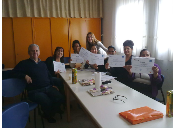
Formación en igualdad de oportunidades impartida por Consultoría de Inzamac