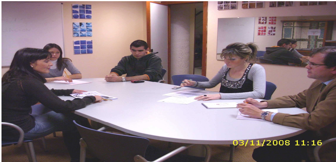
Algunos miembros del Equipo Acreditado en E.I.A. en una revisión de una propuesta

A lo largo del año 2012 el Grupo Inzamac en su conciencia medio ambiental se ha preparado rigurosamente a nivel técnico e instrumental para la impartición de un CURSO DE GESTION DE RESIDUOS URBANOS E INDUSTRIALES , con los siguientes contenidos: